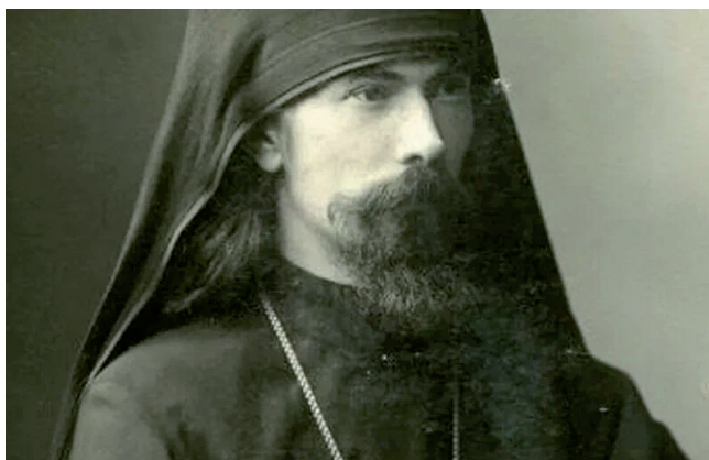
Святитель Феофан Полтавский (Быстров, 1873-1940)