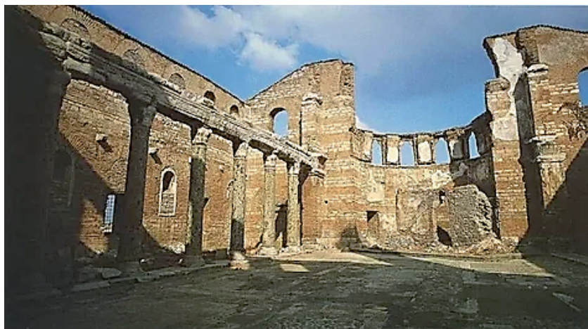
Развалины Студийского монастыря в современном Стамбуле

это крещение действительно, ибо по нужде и закону пременение бывает, как это доказано относительно древности».