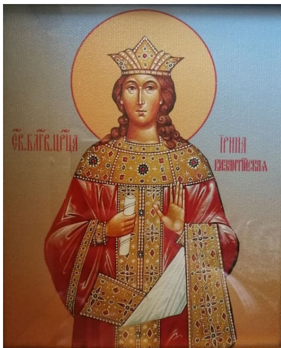
Святая Благоверная Царица Ирина Византийская

гонения не только на сами иконы и иные изображения святых, но и на иконопочитателей приходится именно на период правления Императора Льва V Армянина.