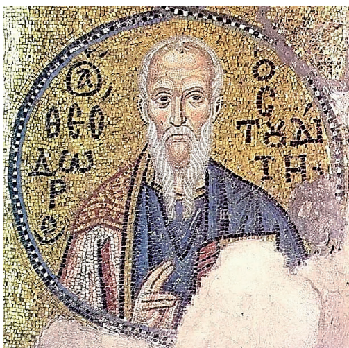
Преподобный Феодор Студит. Мозаика XI века из монастыря Неа Мони на острове Хиос в Эгейском море

По смерти Императора Никифора I Геника (ок. 750-811, годы правления 802-811) при Патриархе Никифоре (758-828, патриаршество 806-815) Феодор вновь возвращается в Студийский монастырь, но спокойная, отлаженная монастырская жизнь прерывается в 815 году, после созыва Львом Армянином очередного иконоборческого собора. Иконопочитатель Патриарх Никифор был сослан и скончался в изгнании, а борьбу против вновь поднявшей голову ереси возглавил Студийский игумен. После организованного им массового крестного хода с многочисленными иконами, Феодор был сослан и заключён в темницу и в течении пяти лет, до прихода к власти Императора Михаила II Травла (ок. 770-829, годы правления 820-829), продолжал свою борьбу в застенках, рассылая письма и воззвания как своим сторонникам, так и своим противникам.