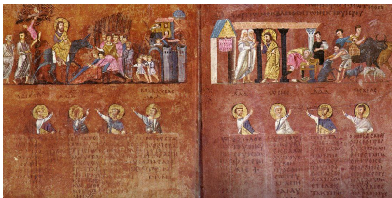
Илл.: Евангелие Россано (VI век): ветхозаветные пророки и цари приветствуют римским салютом Всецаря Иисуса Христа, въезжающего на ослиати в Иерусалим и изгоняющего торговцев из храма